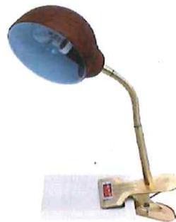
MEINCLGW ゴールドウッドプリント